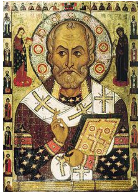
Никола Липный. Алекса Петров. 1294 год. Музей русского искусства в Киеве