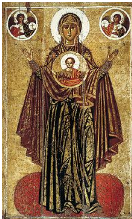
Богоматерь Оранта из Ярославля. Около 1224 года. ГТГ.