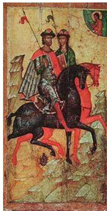
Борис и Глеб. Конец XIV века. ГТГ

Благовещенского собора Московского Кремля. 1380-90 гг.