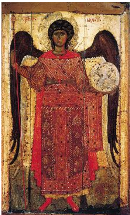
«Архангел Михаил». Около 1299—1300 гг. ГТГ.