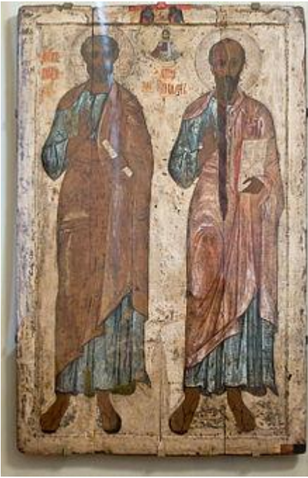
Апостолы Пётр и Павел. Икона середины XIII века. ГРМ.