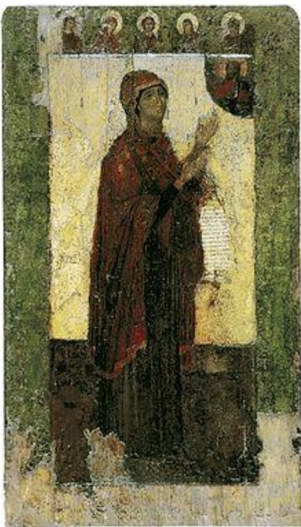
Боголюбская икона Богоматери. XII век