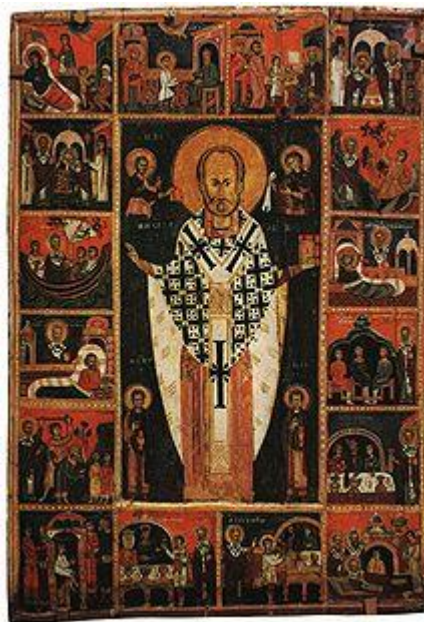
Николай Чудотворец в житии со святыми Косьмой и Дамианом. Икона из погоста Озерёво. Перв пол XIV века.