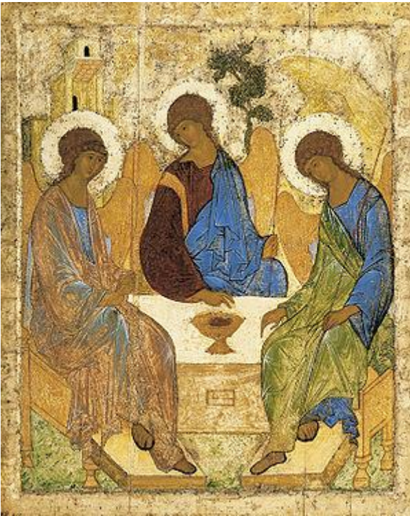
«Троица». 1411 год или 1425-27