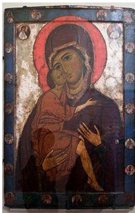
Белозерская икона Богоматери. XIII век. ГРМ. Около 1212 года. ГТГ.