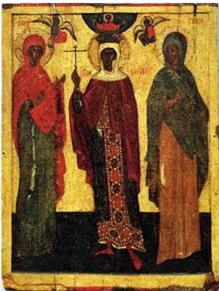
Мученицы Параскева, Варвара и Ульяна.