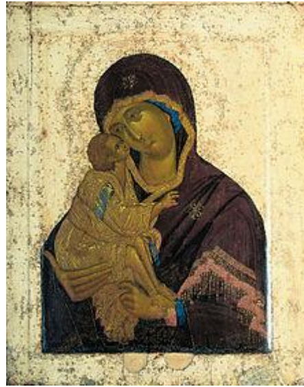
Донская икона Божией Матери