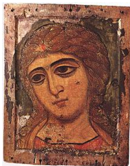
Ангел златые волосы. Конец XII века. ГРМ.