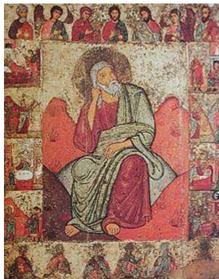
Илья Пророк с житием. Псков. Сер. XIII века. ГТГ