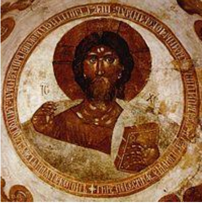
Спас Вседержитель. Роспись купола церкви Спаса Преображения на Ильине улице в Великом Новгороде. 1378 г.