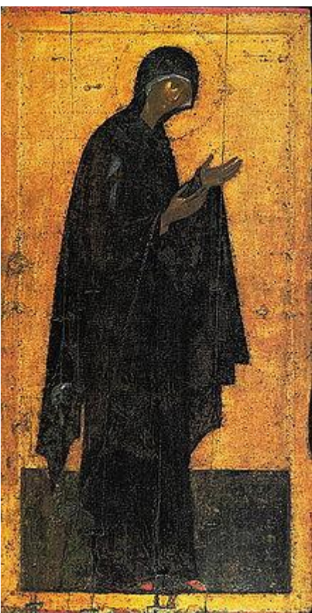
Богоматерь. Икона из деисусного чина

Благовещенского собора Московского Кремля. 1380-90 гг.