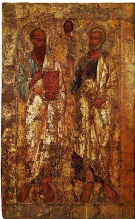
Апостолы Пётр и Павел.

Икона середины XI века. Новгородский музей.