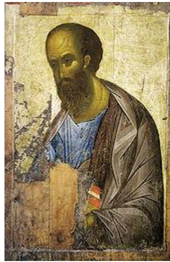
Апостол Павел из Звенигородского чина. 1410—1420