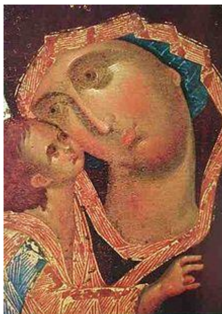
Богоматерь Донская. Конец XIV века. ГТГ. Москва