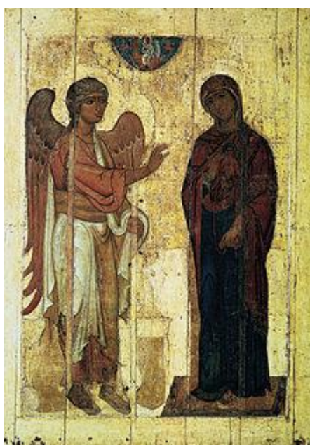
Благовещение «Устюжское». XII век. ГТГ.