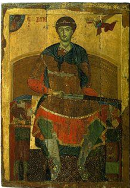
Святой Димитрий Солунский.