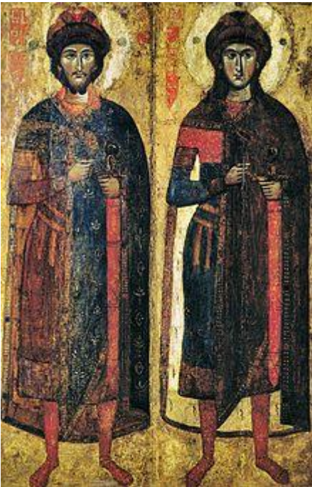
Святые Борис и Глеб. Втор. Полов. XIII века. Новгородский музей